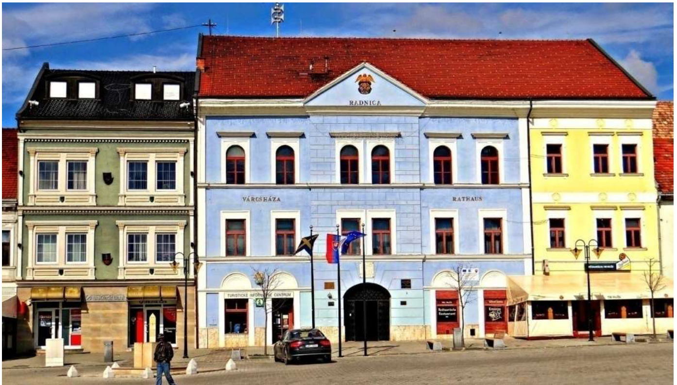
Rathaus von Rosenau, Tagungsort der internationalen Tagung